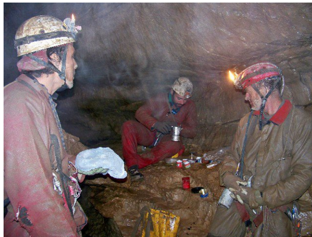
Fig.4 - Pausa caffè presso la Grava dei Gentili