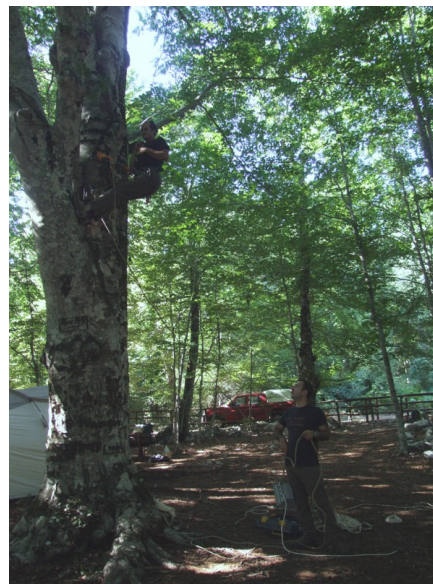
Fig.6 - Preparazione del campo