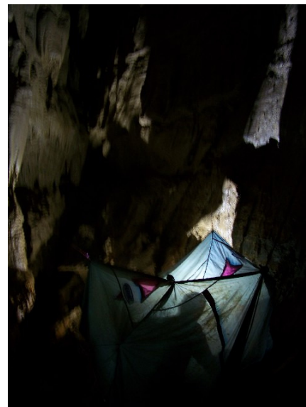
Fig.2 - Grava dei Gentili - Punto caldo a circa -400

L'obiettivo principale del campo, con un progetto condiviso insieme al Gruppo Speleologico Martinese e al Gruppo Speleologico Marchigiano, è consistito nella rivisitazione della Grava dei Gentili (CP 255) a quasi 40 anni circa dall'ultima spedizione del Circolo Speleologico Romano che tanto ha contribuito alla conoscenza dell'inghiottitoio e che, ad oggi, risulta essere ancora il più profondo in territorio campano; sono stati acquisiti documentazione video-fotografica e dati per la rielaborazione del rilievo topografico, effettuate alcune risalite che purtroppo non hanno dato esito positivo, asportati materiali di vecchie esplorazioni giacenti fino alla profondità di -300 metri circa, posizionata linea telefonica per comunicazioni di emergenza fino a circa -150 metri. Le indagini proseguiranno anche nel prossimo mese di settembre.